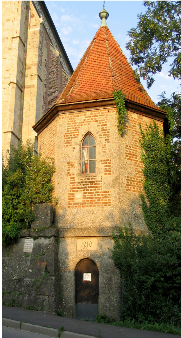
Oktagon hinter der Nikolauskirche, eingeweiht 1910 Blick vom neuen Stadtberg

Wir freuen uns auf rege Teilnahme an den Veranstaltungen!