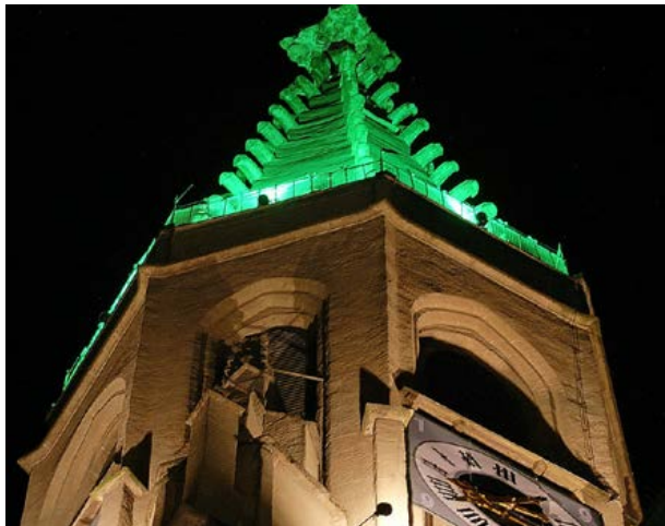
Aktion „Neuötting erstrahlt“ vom 26. September 2009

Kreissparkasse Altötting-Mühldorf IBAN: DE32 7115 1020 0031 2999 51