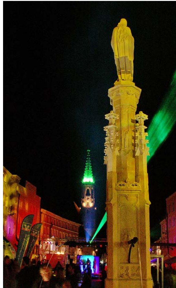
Aktion „Neuötting erstrahlt“ vom 26. September 2009