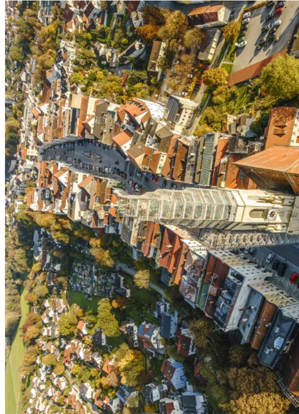
Foto: Archiv Heimatverein - Aufnahme vom 31. Oktober 2016 Fotograf: Webdesign Vierlinger, Kastl

Der Verein wird vertreten durch den 1. Vorsitzenden Herrn Christian Huschka. Telefon: 08671 97 99 01