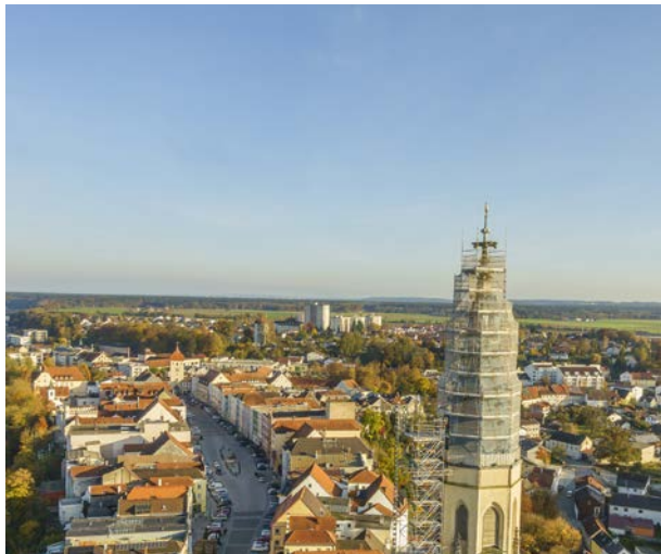
Aufnahme vom 31. Oktober 2016

Kreissparkasse Altötting-Mühldorf IBAN: DE32 7115 1020 0031 2999 51