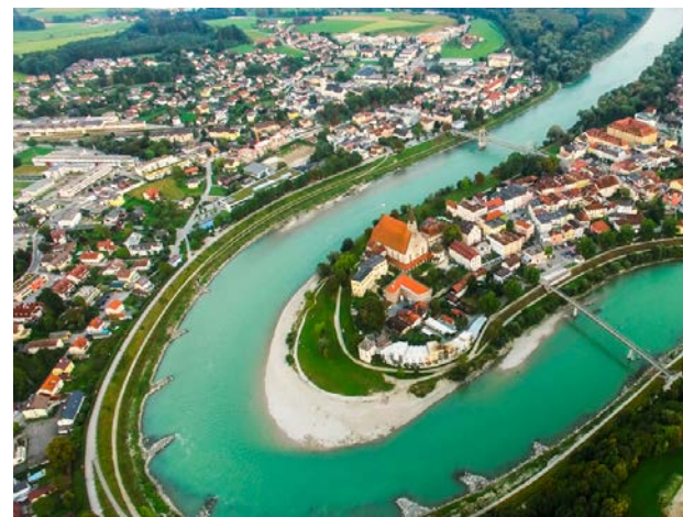
Foto: Salzach zwischen Laufen und Oberndorf

Treffpunkt: Parkplatz am Friedhof um 13:00 Uhr