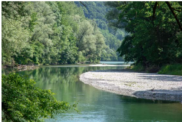
Alzmündung in den Inn

Wir fahren mit privaten PKWs. Wenn im Fahrzeug eines Vereinsmitglieds Platz ist, können Sie dort gerne mitfahren.