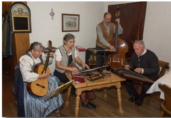
Weihnachtsfeier 2016 - Wieshäuslmusi

Bei weihnachtlicher Musik, Plätzchen, Glühwein und Kaffee stimmen wir uns auf Weihnachten ein.