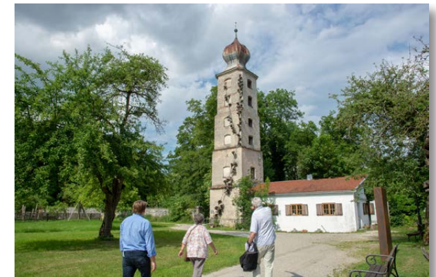
Ausflug nach Raitenhaslach im Juni 2018