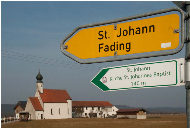
Kirche in St. Johann

Wir freuen uns auf rege Teilnahme an den Veranstaltungen!