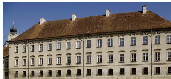
Foto: Klostergebäude des ehem. Zisterzienserklosters, der sog. Prälatenstock, Quelle: Wikipedia - Blauer elephant

Treffpunkt: 13:30 Uhr Parkplatz am Friedhof