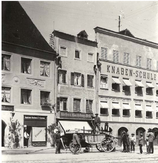
Feuerwehrspritze, jetzt im Museum Neuötting

Kreissparkasse Altötting-Mühldorf IBAN: DE32 7115 1020 0031 2999 51