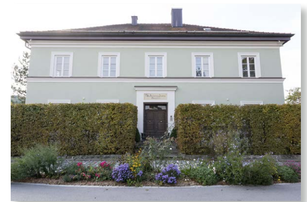
Altes Schulhaus in Alzgern